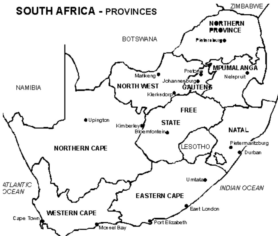
Südafrika mit Provinzen ab 1994